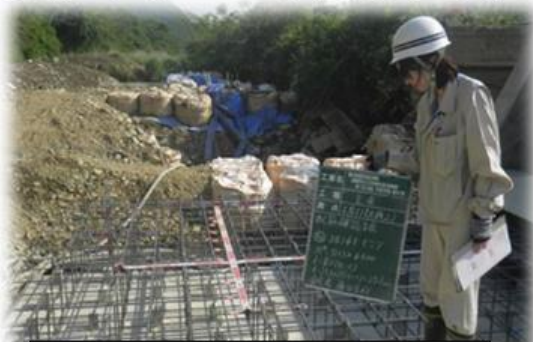
農業用取水堰の改修現場における鉄筋の配置確認